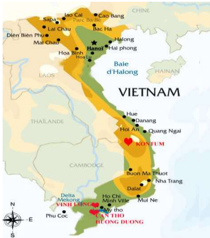
Les structures partenaires en Inde et au Vietnam