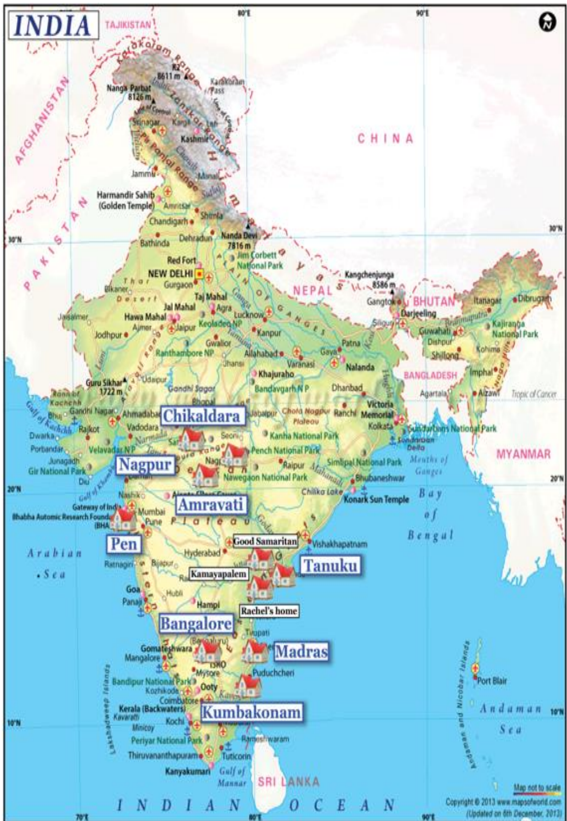
Les structures partenaires et les lieux de vie aidés en Inde