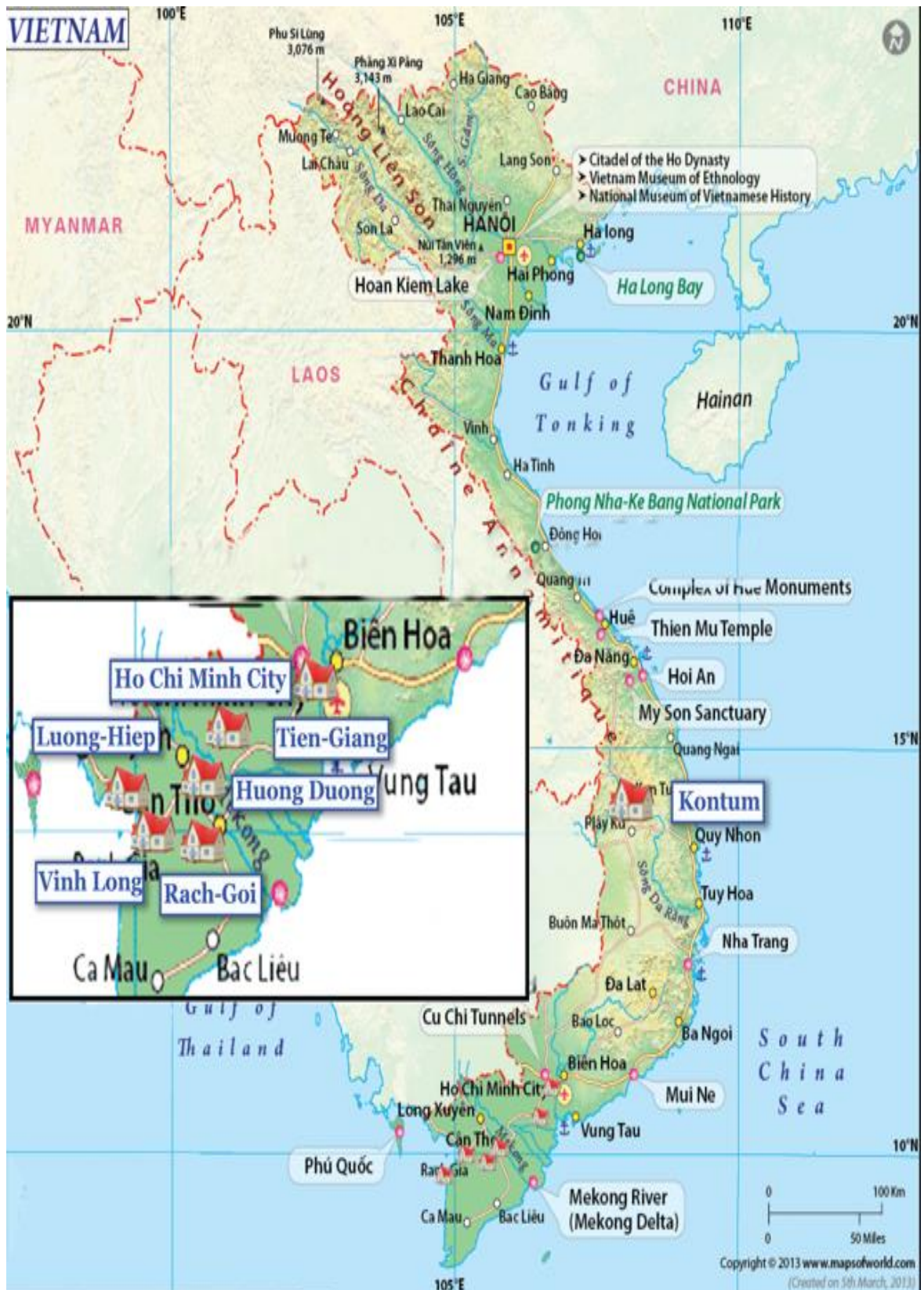
Les structures partenaires et les lieux de vie aidés au Vietnam